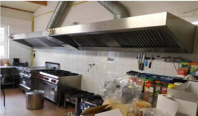
een goed uitgeruste keuken