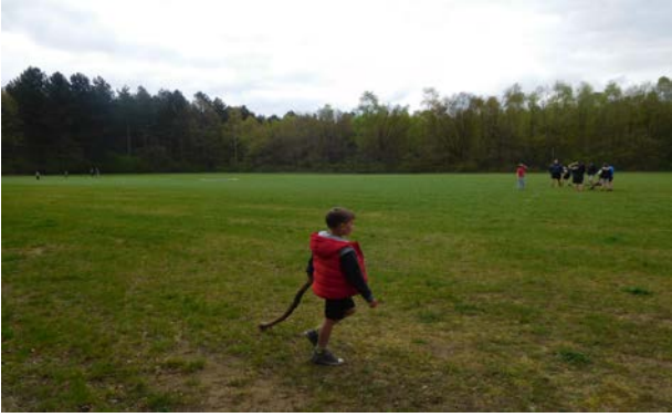
grote speel-en kampeerweide