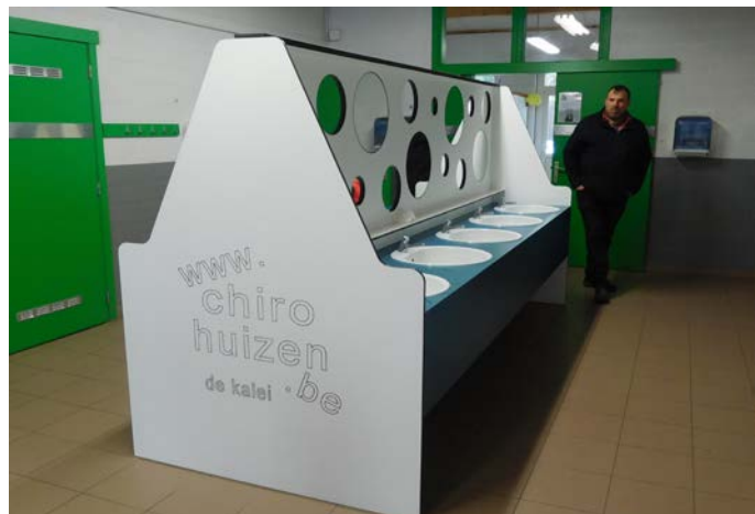
heel degelijk sanitair