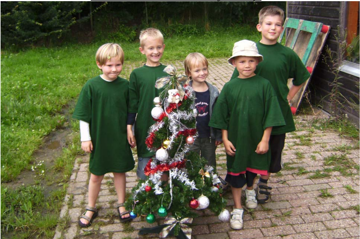
Foto :een kerstboom versieren als opdracht