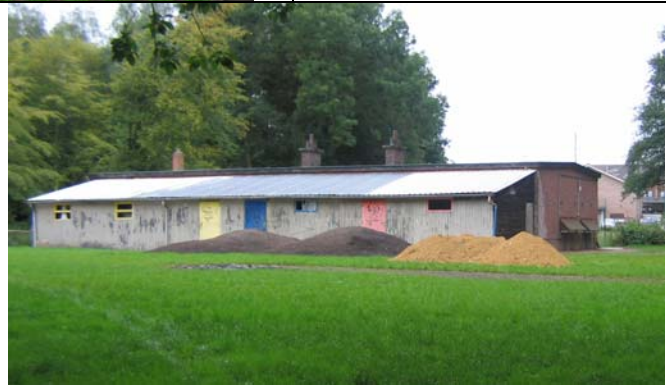
Zicht op het bijgebouw vanuit het bos