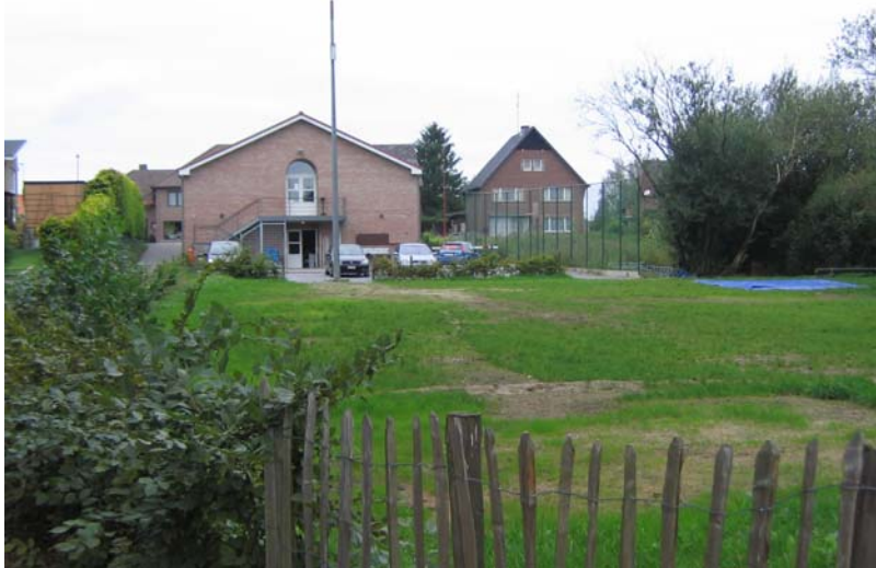
De achterkant van het hoofdgebouw