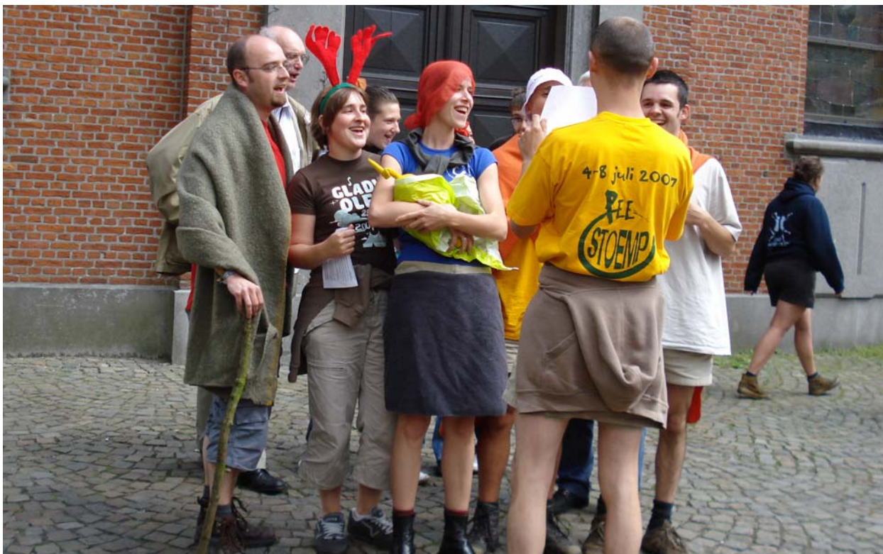
Foto:kerststalfiguren zingen hun liederen