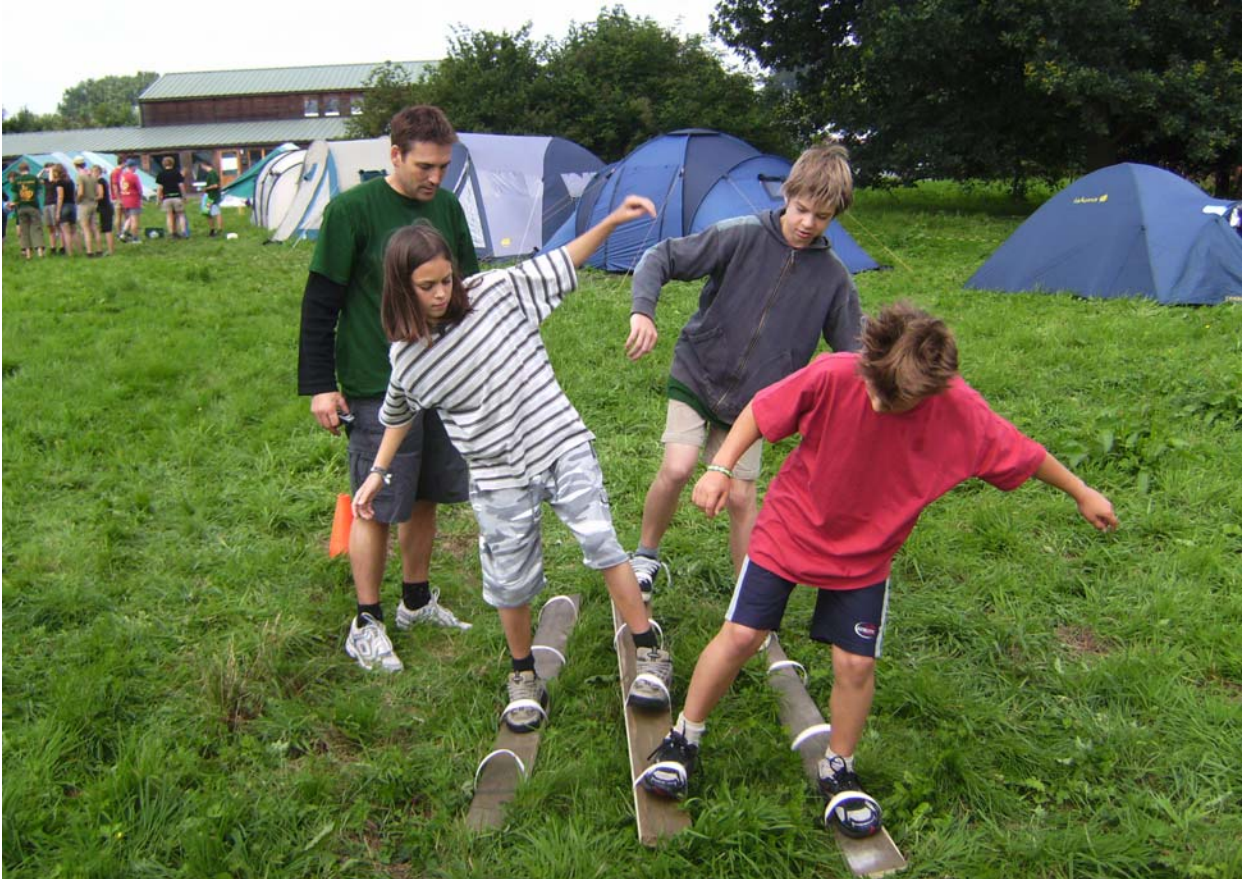
Foto: skiën zonder sneeuw is niet gemakkelijk