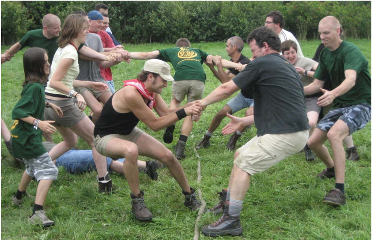
Foto: actie bij de massaspelen