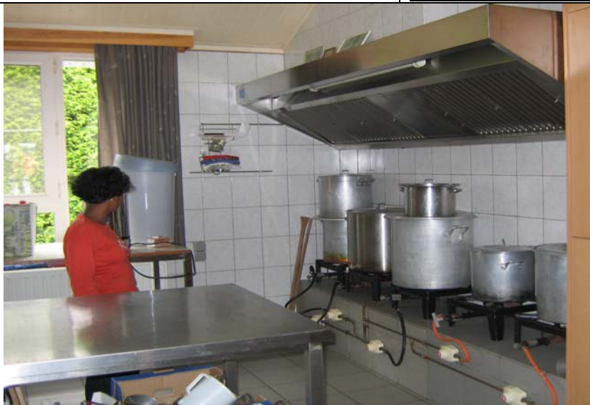
De keuken van onze kampplaats